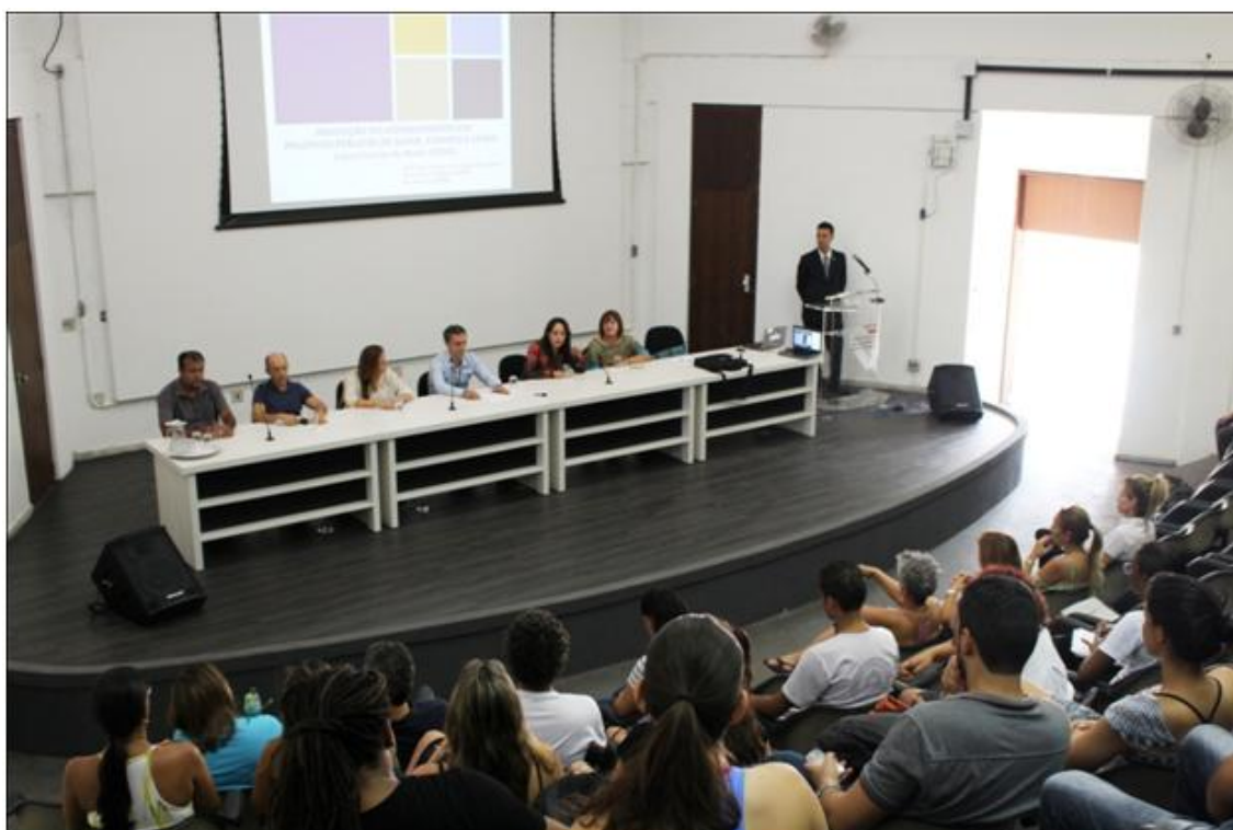
Foto da Palestra