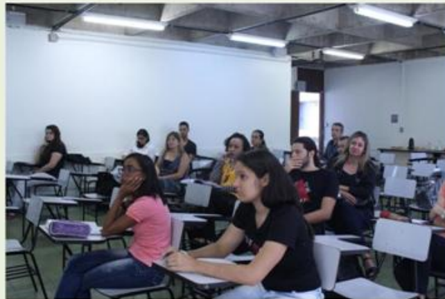
Bolsistas e professores integrantes do Centro MG participaram da reunião

Os integrantes do Centro MG da Rede CEDES se reuniram pela manhã na EEFFTO para realizar uma reunião interna e tiveram como pauta a discussão sobre o planejamento e atividades realizadas em 2016 e o cronograma dos grupos para 2017, além de informes e atualizações sobre as ações do Centro MG.