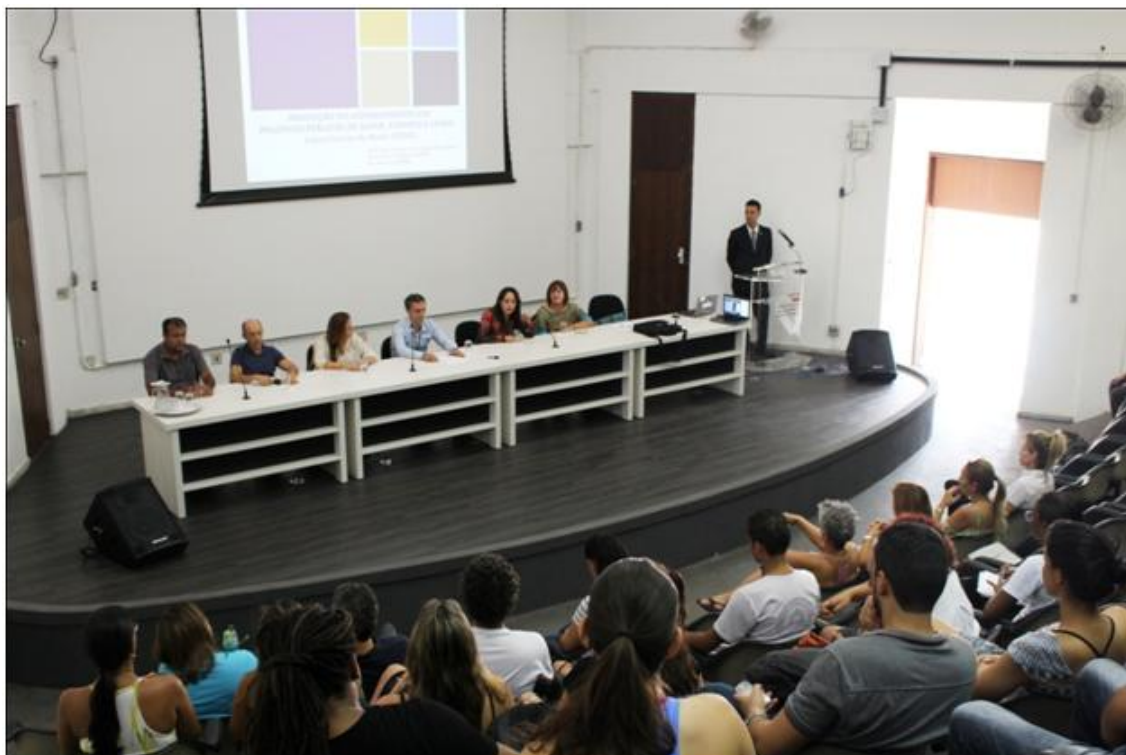
Foto da Palestra