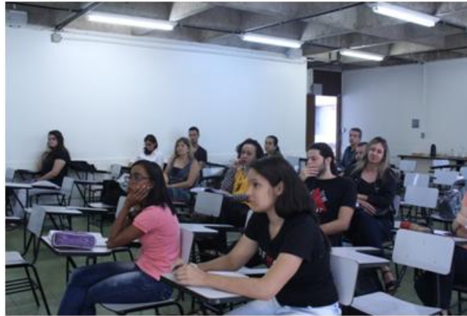
Arte da placa de identificação (em confecção)

CENTRO DE DESENVOLVIMENTO DE PESQUISAS EM POLÍTICAS DE ESPORTE E DE LAZER DA REDE CEDES DO ESTADO DE MINAS GERAIS